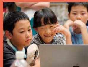
※2025年度プログラムの様子